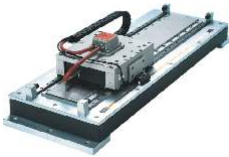
Stage with LMS-P motor